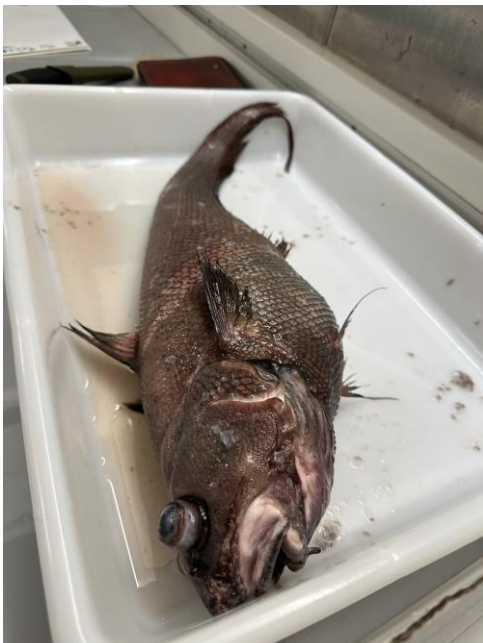
Grenadier des abysses

Quelques-unes des espèces marines remontées des fonds océaniques, à 4800 m